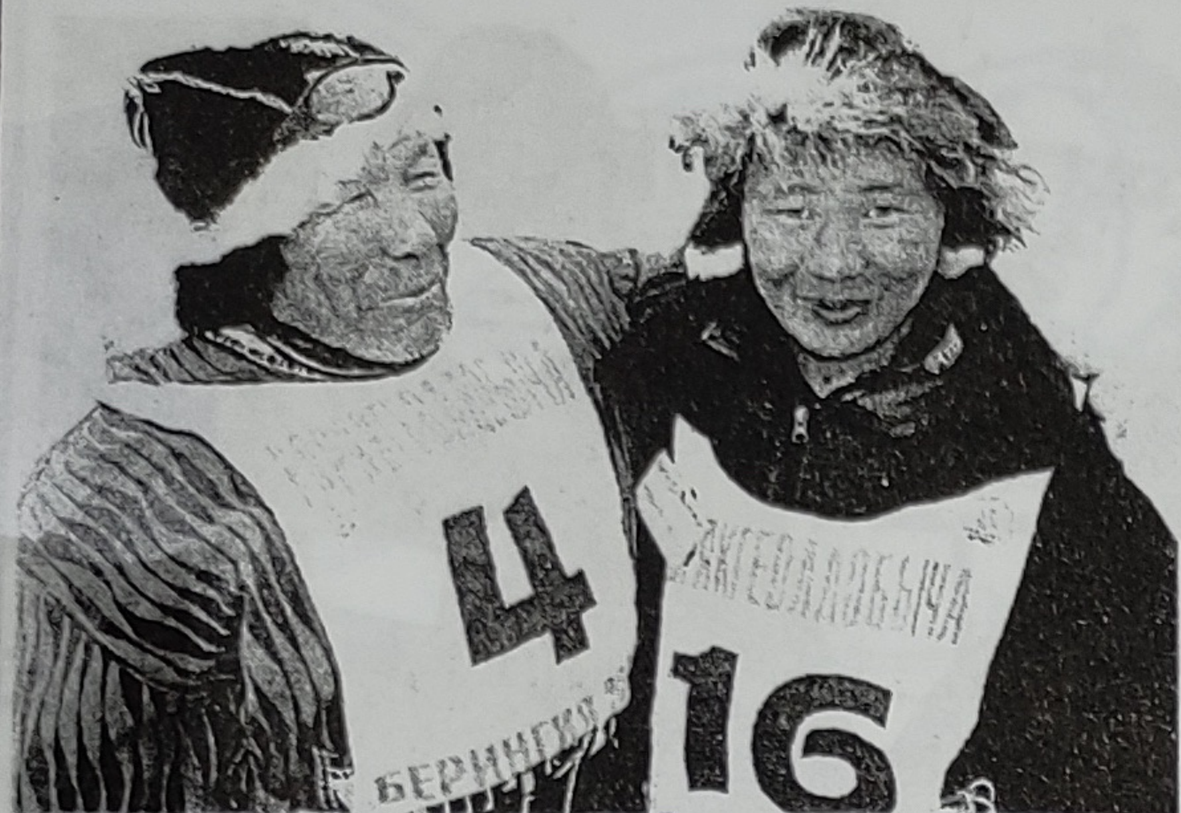
Окончание. Начало на 2 стр.

незаурядным мужеством и выносливостью, чтобы не сломаться, продолжить путь к намеченной цели.